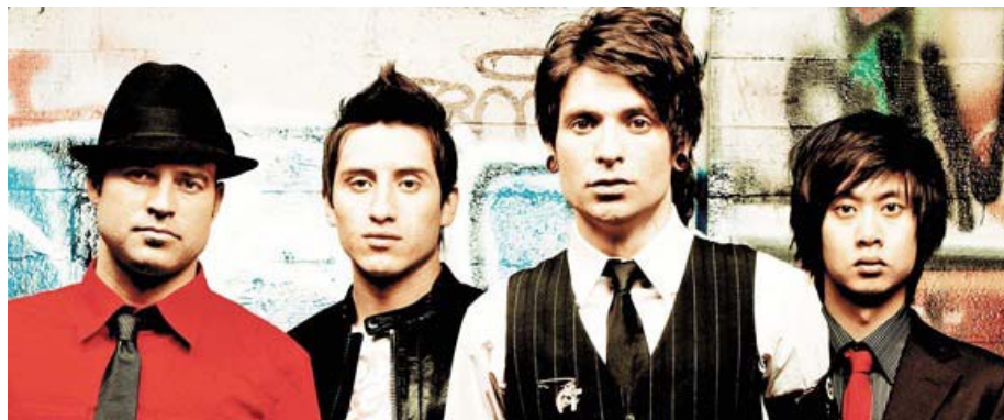
El grupo bicultural se presentará en el bar Kung Fu Necktie con su nuevo disco "Fugitives of pleasure/pasajeros".

Por Ana Gamboa / Redacción AL DÍA 14:00 | 08/13/09